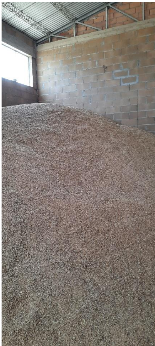
Figura 4 – stoccaggio temporaneo in magazzino