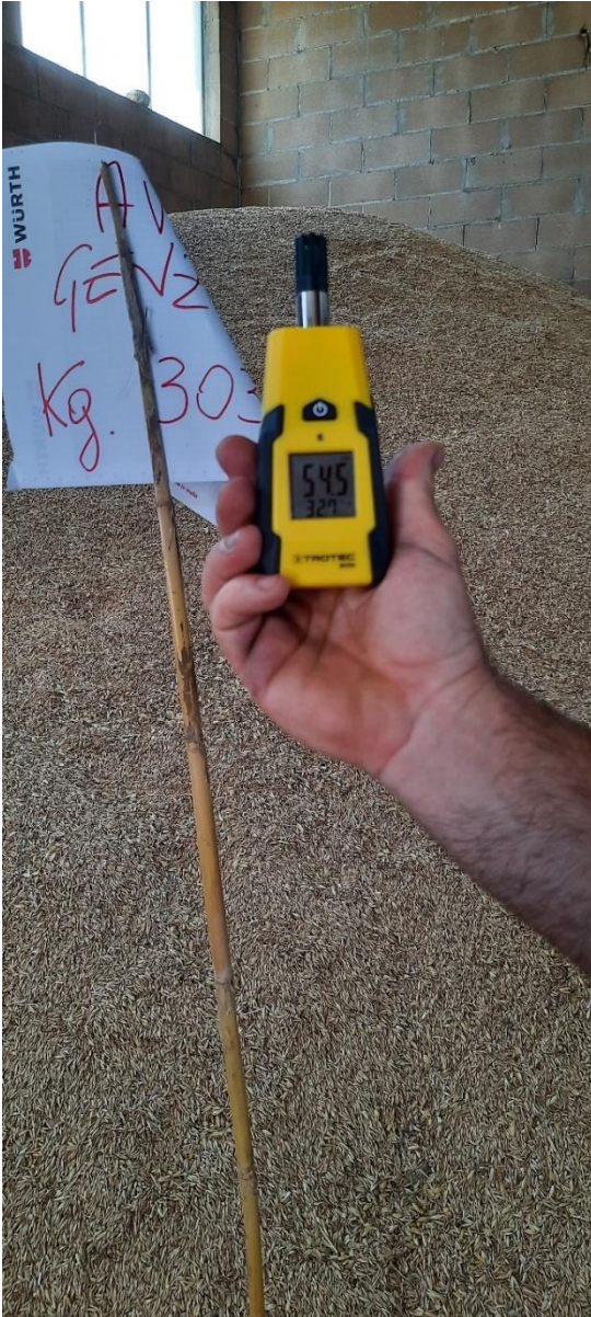
Figura 5 – monitoraggio umidità e temperature in magazzino